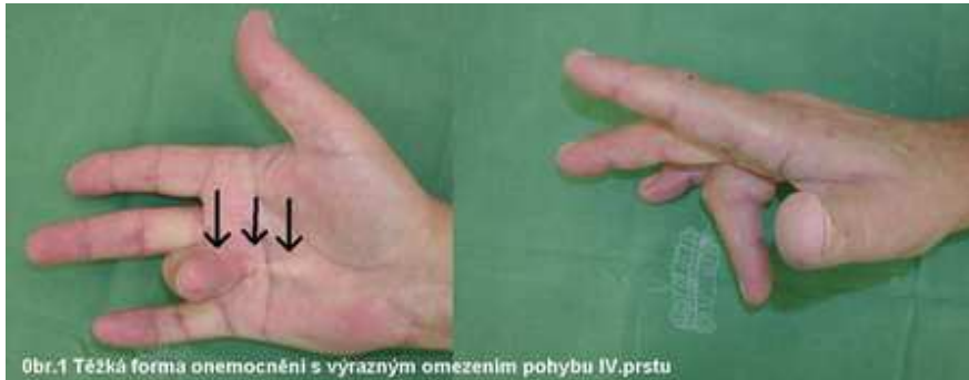
Obr.1 Těžká forma onemocnění s výrazným omezením pohybu IV.prstu

Projevuje se vznikem uzlů a pruhů ve dlani jdoucích směrem k prstům ruky. Uzly a pruhy se postupně šíří a dochází k tzv. flekční kontraktuře (ohnutí). Kontraktury omezují natažení prstů a vedou k funkčním obtížím při denních činnostech nebo pracovní zátěži.